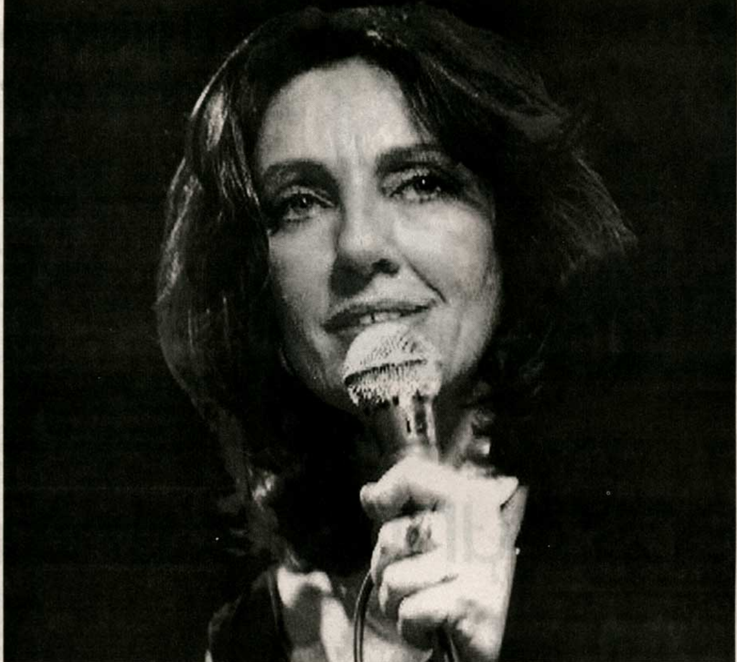
BUENOS AIRES. La cantante repetirá el show de mañana en la capital argentina el próximo 17

LA INTERPRETE PRESENTARA EL DISCO SOLISTA HOMONIMO